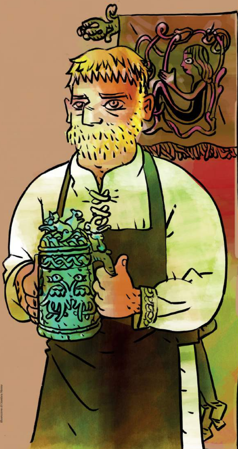
Illustrazione di Gianluca Manna